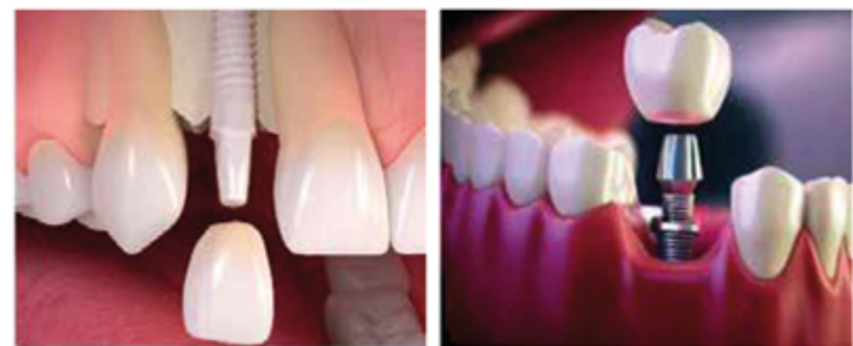
Impianto in ceramica

Oltre all'aspetto particolarmente naturale e gradevole è progettato per un'adesione eccellente dei tessuti molli ed una contenuta risposta infiammatoria.