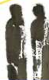
Milano Filadelfia * La Divina Commedia, 2002