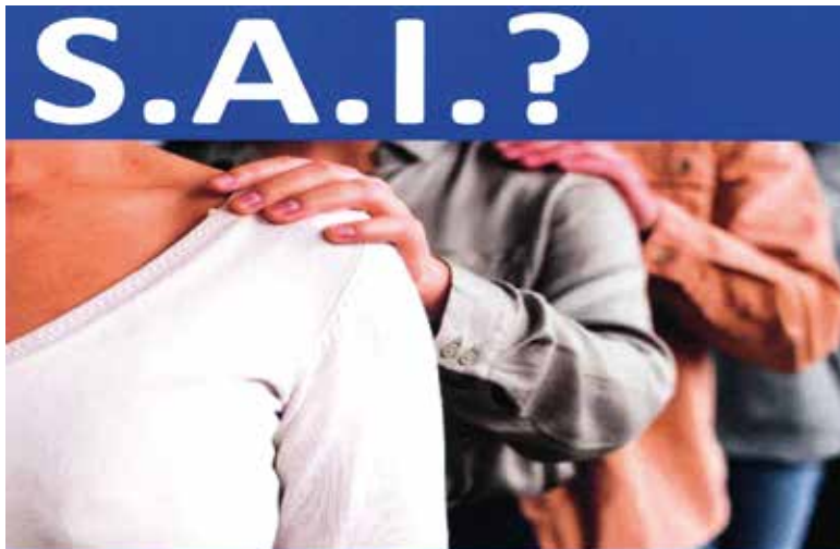
Sportello a disposizione delle p.c.d. (persone con disabilità) e delle loro famiglie